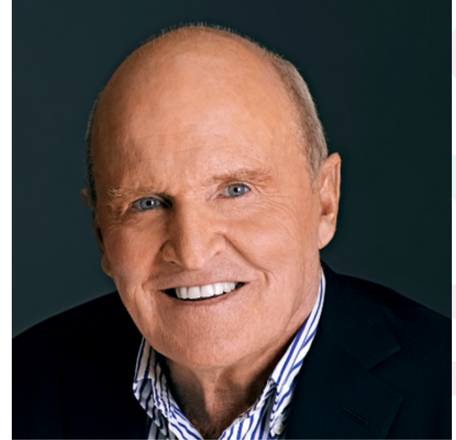
Jack Welch Ex- Presidente da General Eletric

“No futuro todos os líderes serão coaches. Quem não desenvolver essa habilidade, automaticamente será descartado do mercado”.